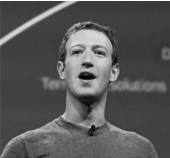
ثروت مارك زوكربيرج وصلت إلى 72 مليار إسترليني، مسجلة ارتفاعا بقيمة 29 مليار، بعد أن كانت في مارس لا تتخطى 43 مليار