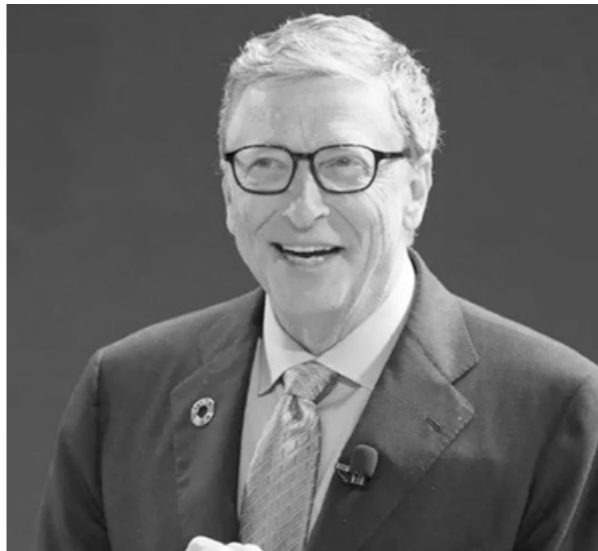
بيل جيتس وصلت ثروته إلى 93 مليار إسترليني، في حين كانت بمارس 77 مليار