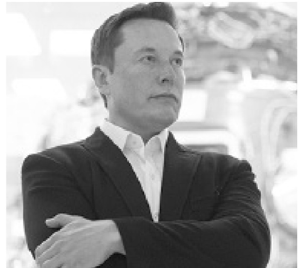
ثروة إيلون ماسك وصلت إلى 59 مليار جنيه إسترليني، بعد أن كانت لا تتجاوز 19,7 مليارات في مارس