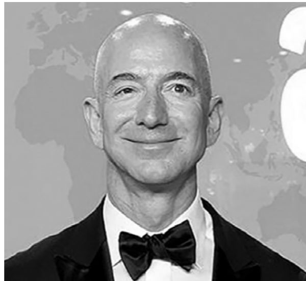
جيف بيزوس أصبح الشخص الأكثر ثراء في العالم بعدما كسب 10 مليارات جنيه إسترليني في يوم واحد