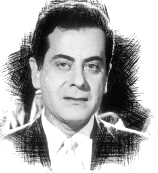
حيلة تفتك بحياء فريد الأطرش؛

حكى «محمد فوزى» في إحدى حواراته الصحفية أنه في سنه الأولى ذهبت أخته الصغيرة إلى الإسكندرية للاستحمام، وهناك التقى بفتاة جميلة وجذابة على البلاجات وتبادلوا الابتسامات، ثم تكررت اللقاءات بينهما، لكنه لاحظ أنه كان يرافقها في كل مرة سائق الأسرة، ووصفه بأنه كان شاب وسيم، كما لاحظ عليه أنه معتد بذاته مهتم بآرائه، وحينما سألت الفتاة عن ذلك أجابته إنه نشأ في أسرته منذ كان في السابعة من عمره، ومع مرور الوقت اشتعلت علاقة الحب بين فوزى وفتاته، حتى اتفقا على الزواج وأعطى هذا السواق بقشيشاً من فرحته بتلك الخطوة، وخلال رجوع أسرة الفتاة إلى القاهرة وتخلط فوزى عنهم ومكثت فترة في الإسكندرية، فوجئ بعد رجوعه بأسبوعين أن فتاته تزوجت السواق في بيت أسرته.