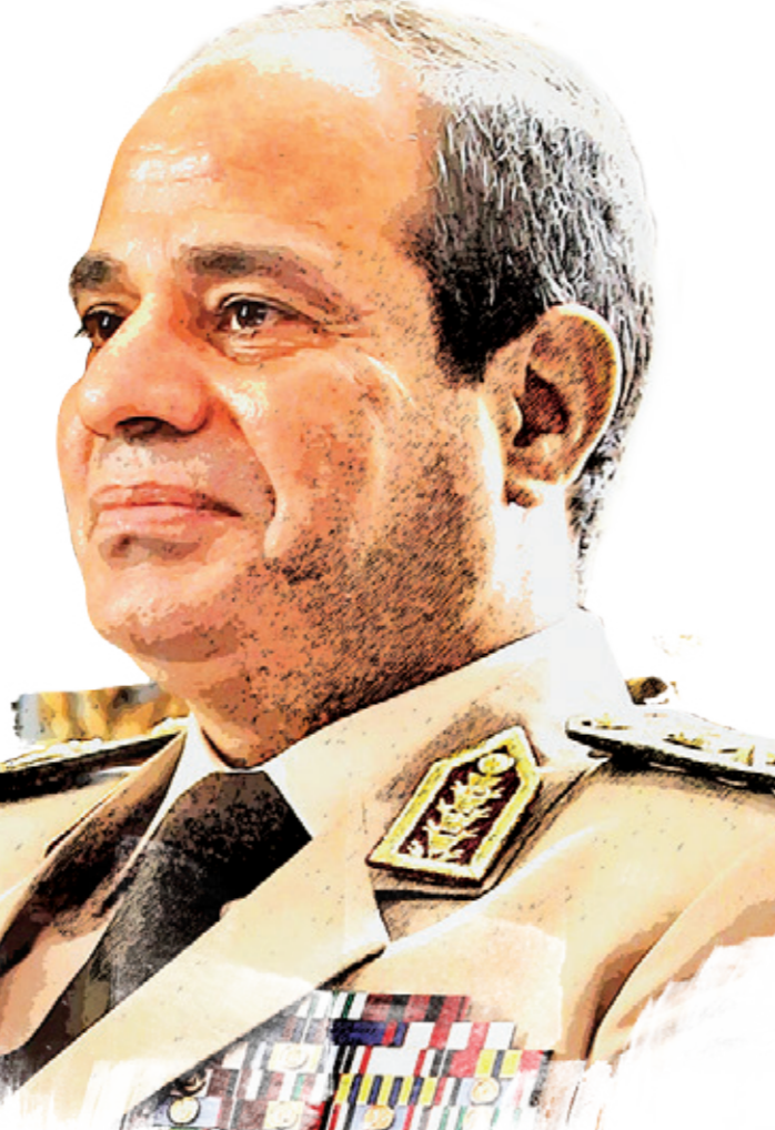
تعيينه من قبل مبارك كمحافظ

انتهت الحرب الباردة ودور مصر الإقليمي تضائل كثيرا، لكن السيسي يسعى لإحياء الكبرياء القومية، وربما في جزء منه لتعويض عن المشاكل الداخلية هو أمر لا مفر منه. ويضيف سيرنجبورج أن تعاملات السيسي الأخيرة مع روسيا، بما في ذلك توقيت رحلته لموسكو لإتمام صفقة الأسلحة، كان التصدي جزء منها هو إطلاق حملته الرئاسية الانتخابية، كما أنه في هذه الزيارة يستحضر ذكريات عبد الناصر وتلاعبه مع الغرب بتوجهه إلى جانب السوفييت. لكن في الواقع، فإن أي صفقة أسلحة مع موسكو تعتبر في جزء كبير منها غطاء سياسيا ليخفى الاعتماد المستمر للجيش المصري على الولايات المتحدة من كونه تأكيد للاستقلال الحقيقي لمصر عن أمريكا. أما بالنسبة للاقتصاد المحلي، يقول سيرنجبورج أن السيسي يحاول مرة أخرى أن يسير في ظل عبد الناصر، بل يبدو أن ظل ناصر يلوح في الأفق بشكل أكبر من السيسي نفسه، الذي يعتبر بالفعل أن الحقبة الجديدة هي مرحلة المشاريع الكبرى، تماما كما فعل ناصر مع سد أسوان ومختلف المشاريع الأخرى.